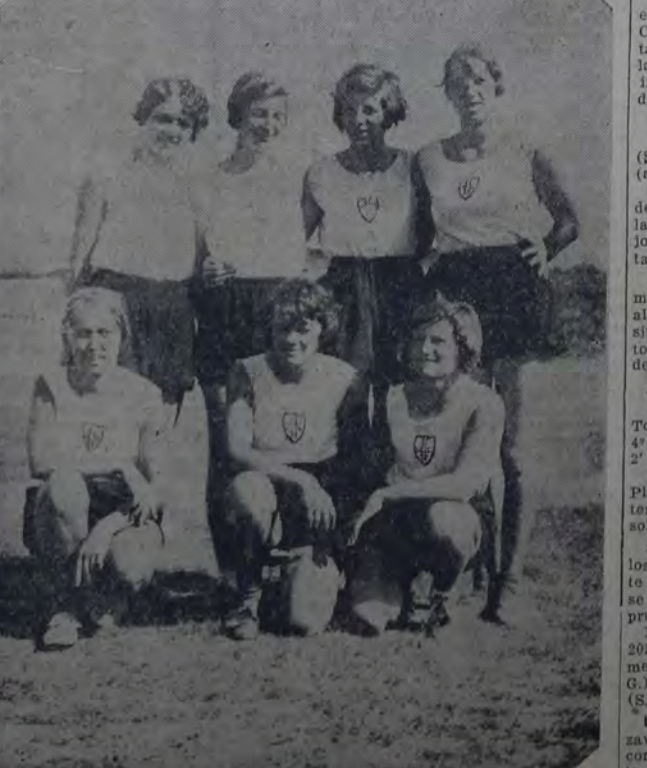
CONJUNTO DE LA SOCIEDAD ALEMANA DE GIMNASIA QUE OBTUVO el primer puesto en el certamen nacional correspondiente al año en curso, organizado por la Federación Atlética Femenina Argentina.